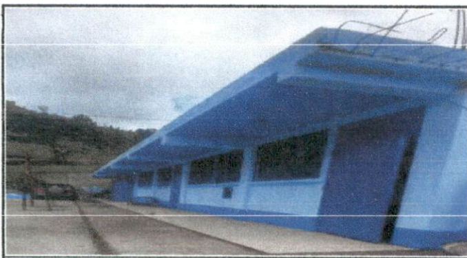
Foto 5: Fabricación e instalación de balcones de hierro en ventana.