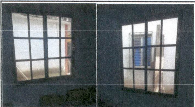
Foto 3: sustitucion de estructura de metal de ventanas y sustitución de vidrios.