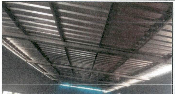
Foto 2: Sustitución de estructura de soporte de madera, por metal.