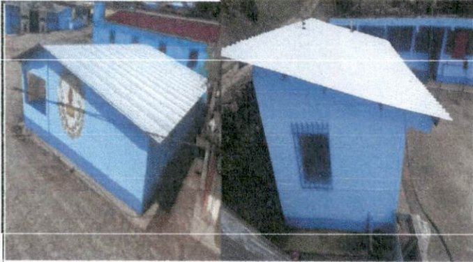
Foto1: Sustitución de lámina, por lámina troquelada aluzinc calibre 26.